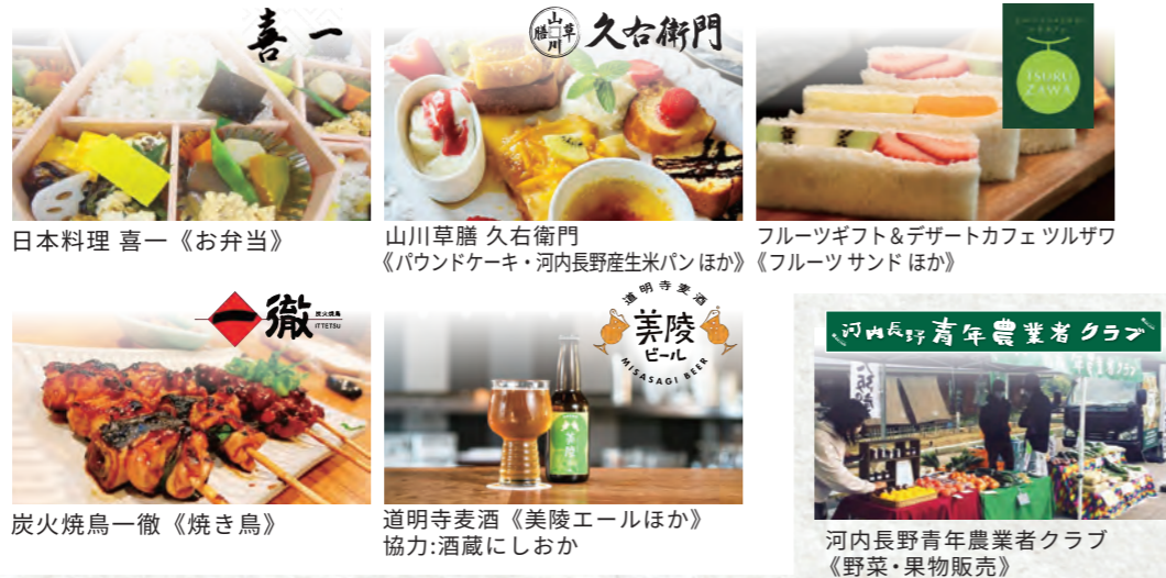
日本料理 喜一 《お弁当》