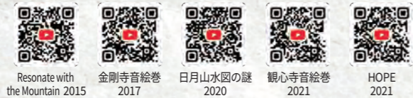
Resonate with the Mountain 2015 金剛寺音絵巻 2017 日月山水図の謎 2020 観心寺音絵巻 2021 HOPE 2021

[SAKITA HAJIME official YOUTUBE channel]