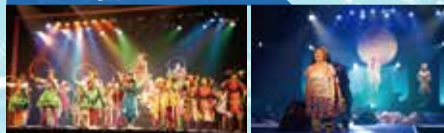
エターナルガーデン(2016) ムーンライトミステリー(2017)

今回、2008年の初演作品を再演するにあたり、台本の改訂もお願いしましたが、改訂するうえで特にこだわったことは?